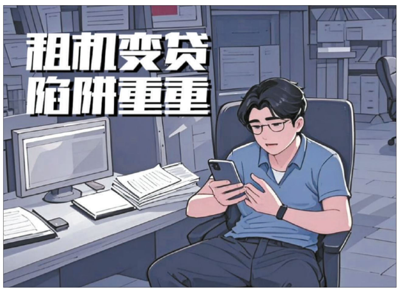
AI人机协同生成的海报

“租机贷”作为新型金融犯罪套路，引发关注。不法分子打出诱人广告引入入局，租机平台、贷款中介、手机回收商等多方联手，形成一条完整的利益链条。新断非法放贷利益链，强化金融放贷治理，引导资金流向合法、规范的金融渠道，成为金融监管的重中之重。