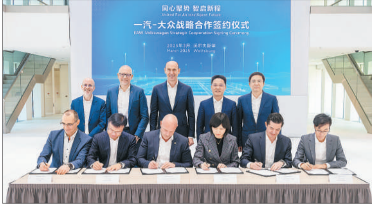
日前,中国一汽与大众汽车集团在德签署战略合作协议,宣布自2026年起,一汽-大众大众品牌和捷达品牌将在多个细分市场新增11款为中国市场量身打造的全新车型...