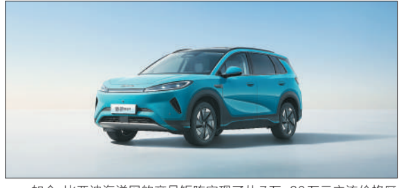
如今,比亚迪海洋网的产品矩阵实现了从7万-30万元主流价格区间的全覆盖。

曹旭东认为,过去,新能源汽车的主要卖点是续航、电池和成本,但随着市场成熟,智能化已成为新能源汽车竞争的关键因素。