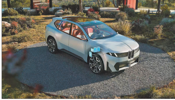
宝马宣布,在中国深度融合鸿蒙生态,推出包括BMW数字钥匙、HUAWEI HiCar和MyBMW App在内的数字化服务,基于HarmonyOS NEXT开发多元化智能应用与功能...

“今天,全球汽车产业面临重大机遇和挑战,中德双方股东将继续秉持全球视野,依托三十余年的合作积淀,战略协同、共创共进,加速构建新质生产力生态。”